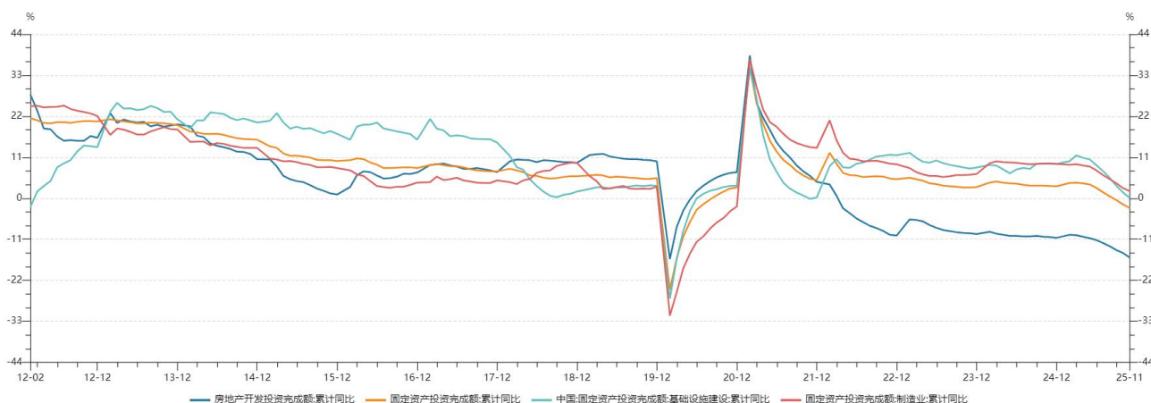
图1 全国固定资产投资完成额累计同比

12月15日国家统计局公布11月主要宏观经济数据。1-11月份，全国固定资产投资同比下降2.6%，市场预期下降2.2%，1-10月份为同比下降1.7%。分类来看，1-11月份广义基建投资（含电力）同比增长0.1%，市场预期1.5%，1-10月增长1.5%，2024年同比增长9.2%。1-11月份狭义基建投资（不含电力）同比下降1.1%，1-10月下降0.1%，2024年全年同比增长4.4%。1-11月份制造业投资同比增长1.9%，市场预期增长0.6%，1-10月增长2.7%，2024年同比增长9.2%。1-11月份，全国房地产开发投资同比下降15.9%，市场预期同比下降15.4%，1-10月下降14.7%，2024年同比下降10.6%。1-11月份民间固定资产投资同比下降5.3%，1-10月同比下降4.5%。从单月数据来看，11月制造业投资同比下降4.5%，前值同比下降6.7%；11月狭义基建投资（不含电力）同比下降9.7%，前值同比下降8.9%。11月份，全国固定资产投资环比下降1.03%，10月份修正后环比下降1.51%，国家统计局修正后的环比数据显示全国固定资产投资连续第十个月环比下降。11月固定资产投资降幅超过市场预期，新型政策性金融工具带动投资扩张的作用未明显体现。